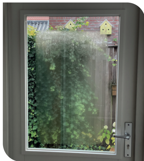
Condensvorming aan de kamerzijde.

Condensvorming aan de kamerzijde ontstaat meestal bij een lage buitentemperatuur en een hoge relatieve luchtvochtigheid in de woning. Het aanwezige vocht condenseert dan tegen het glasoppervlak. Bij isolerende beglazing met een goede isolatiewaarde zoals HR isolerend dubbelglas is dit risico kleiner dan bij glas met een slechte isolatiewaarde zoals enkelglas. Dit is ook afhankelijk van de specifieke situatie. Belangrijk is te weten dat condens aan de kamerzijde geen fout in het product is. Eventuele condensvorming is te voorkomen door goed te ventileren. Zeker als je de bestaande beglazing laat vervangen, moet dus goed worden gekeken naar de mogelijkheden om te ventileren.