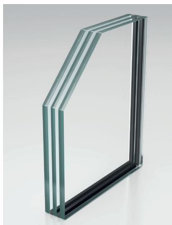
Gelaagd glas met silicatelayers: wanneer bij een brand het glas breekt, schuimt de tussenlaag op en vermindert de warmtestraling en de temperatuur. Ook vormt dit een tijdelijke barrière tegen rook en vlammen.

Het feit dat er brandwerend glas bestaat, betekent dus ook dat standaard (isolatie)glas niet per definitie brandwerend is. Bij een brand neemt de temperatuur zo snel toe dat het aanwezige float glas onder hoge thermische spanning komt te staan. Dit zorgt ervoor dat glas bij een brand relatief snel breekt. Enkelglas, maar ook